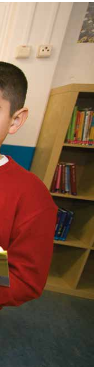
← Alle leesniveaus moeten goed vertegenwoordigd zijn.